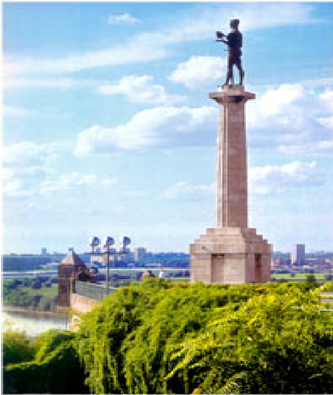
ЗА ВЕДРО НЕБО СВИМА Споменик победнику на Калемегдану