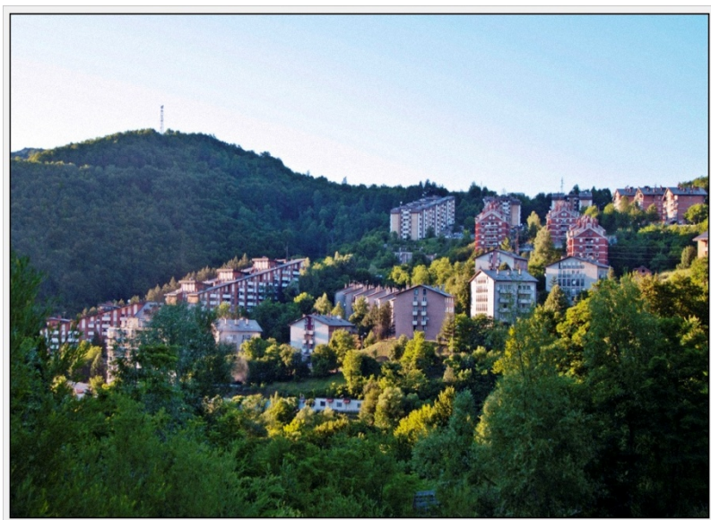
СУНЦА ЈЕ ВИШЕ Мајданпек – део горњег града