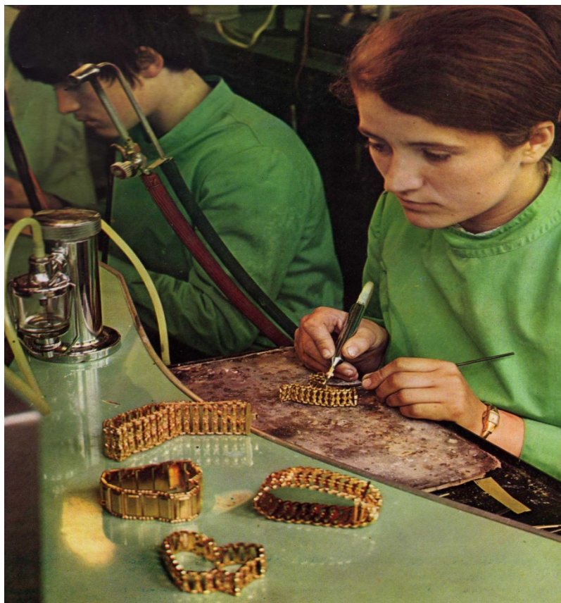
ПОЗЛАЋУЈУ НАПОРЕ РУДАРА Детаљ из Златаре Мајданпек