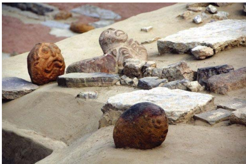
ИЗ НЕОЛИТСКОГ НАЛАЗИШТА ЛЕПЕНСКИ ВИР