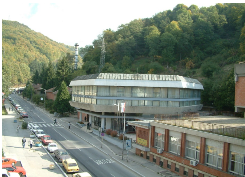
ЦЕНТАР КРЕАТИВНОСТИ И ДУХОВНЕ ЛЕПОТЕ Дом омладине Мајданпека , седиште Центра за културу