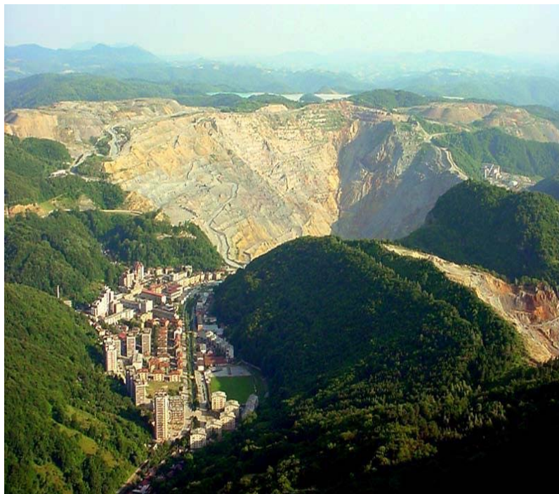
ЗАЈЕДНИЧКИ РАСТ Мајданпек - део доњег града са Површинским копом Рудника бакра