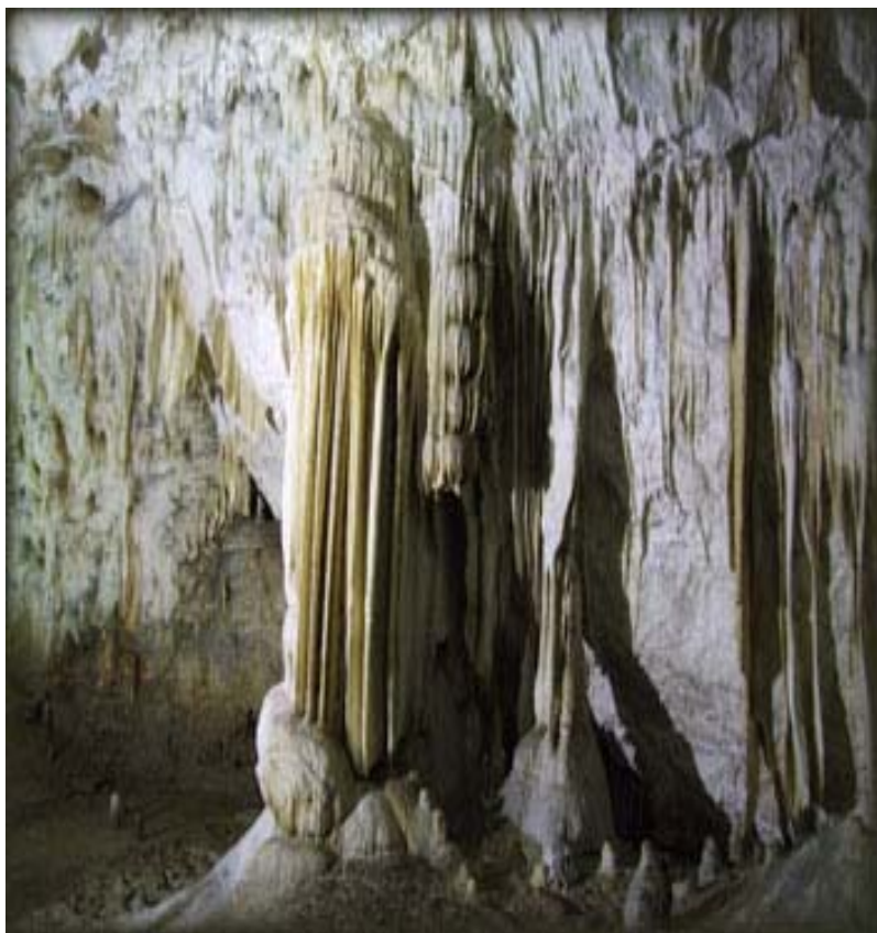
ЦИНОВСКЕ ОРГУЉЕ Детаљ из Рајкове пећине