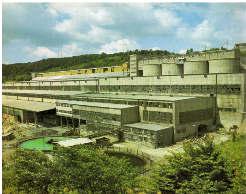
ЛЕПА И ПРКОСНА Флотација РБМ, прва по величини у Европи, а трећа на свету