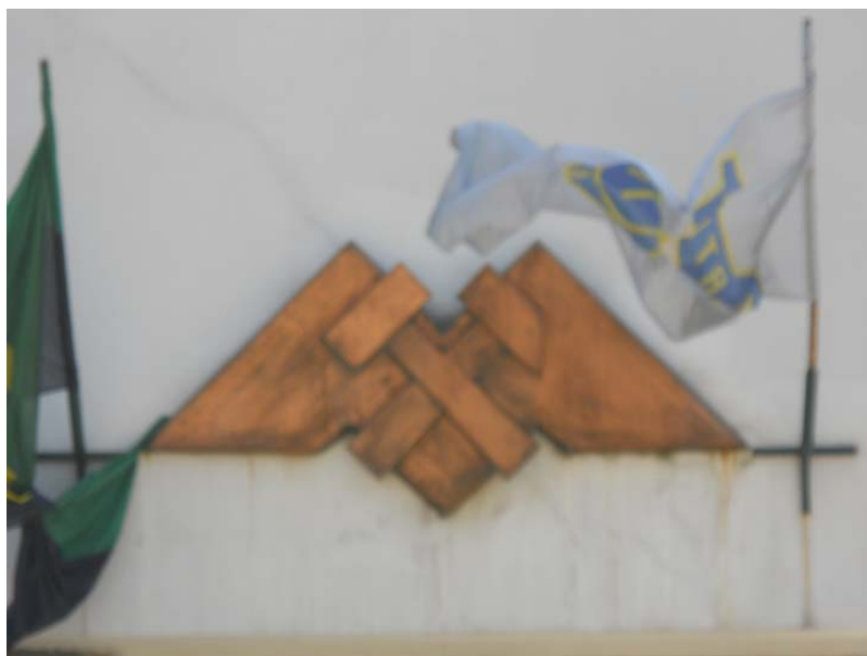
СИМБОЛ ПРОГРЕСА Амблем Рудника бакра Мајданпек