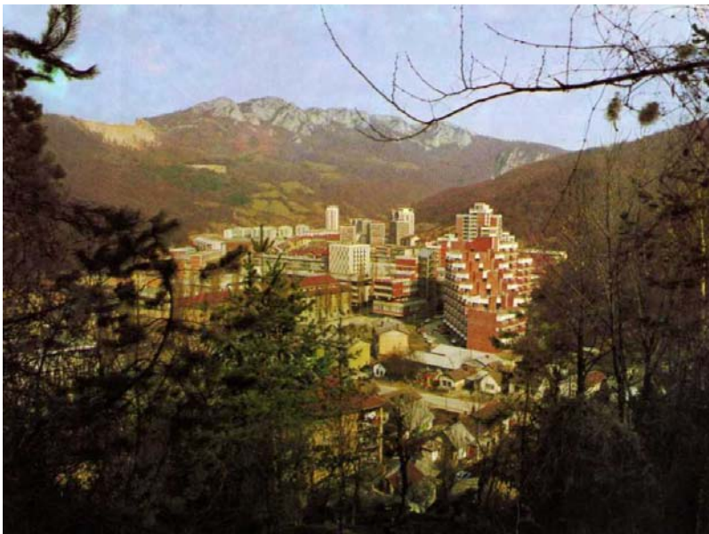
ПРОЦВЕТАО ИЗ БАКРА Мајданпек – доњи део града

бакром нам се речи оре бакарне нам свићу зоре црвене као рудара дело