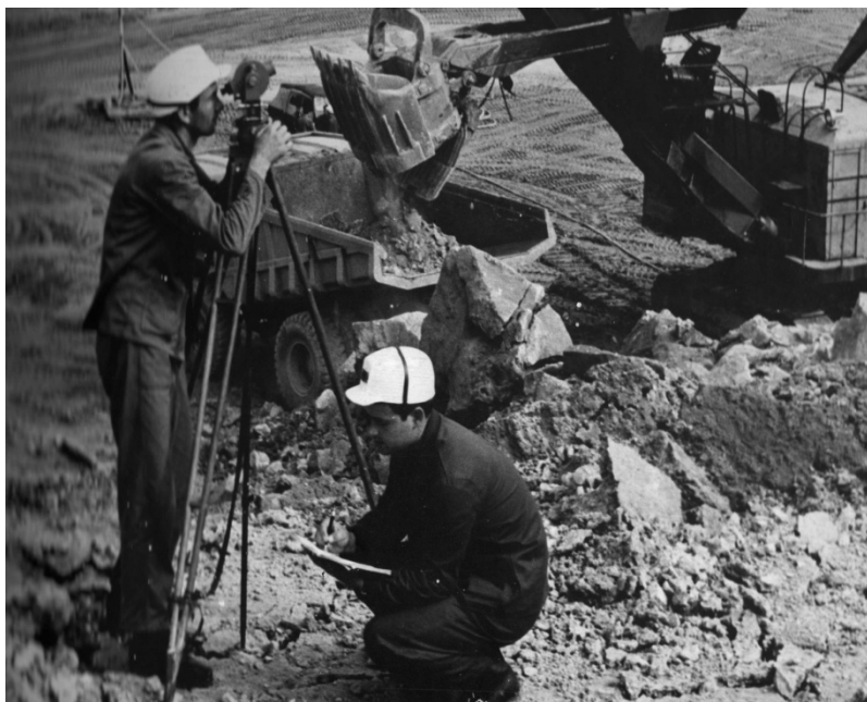
ПРЕТХОДНИЦА РАСТА Геометри на Површинском копу РБМ