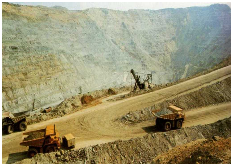
НЕУМОРНИ ПОЈ МАШИНА Површински коп Рудника бакра Мајданпек, 2005. године