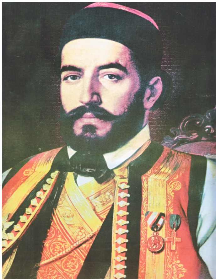
ЗА ТОПУЗ ПРАВДЕ Петар Петровић Његош