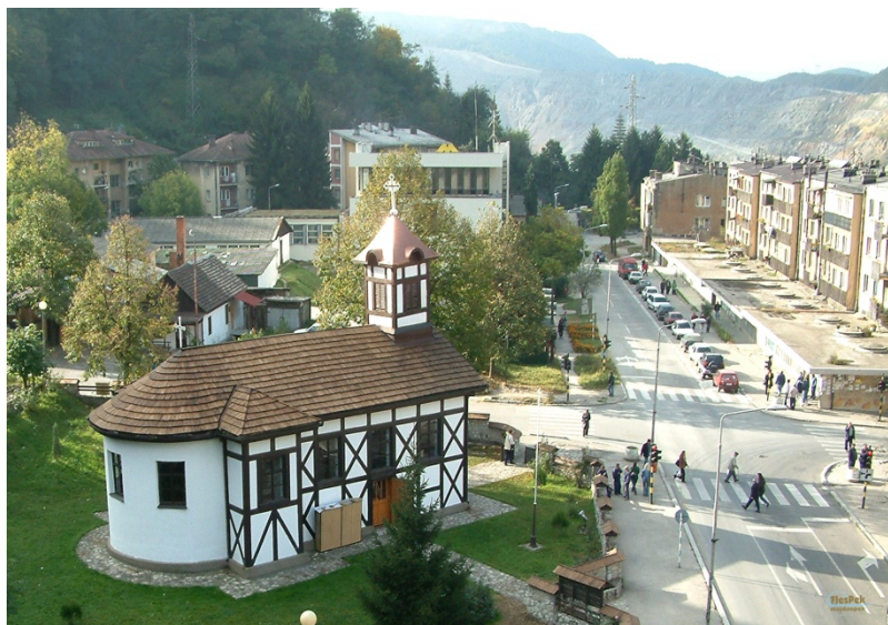
ОСОБЕНА ЛЕПОТА Мајданпечка црква