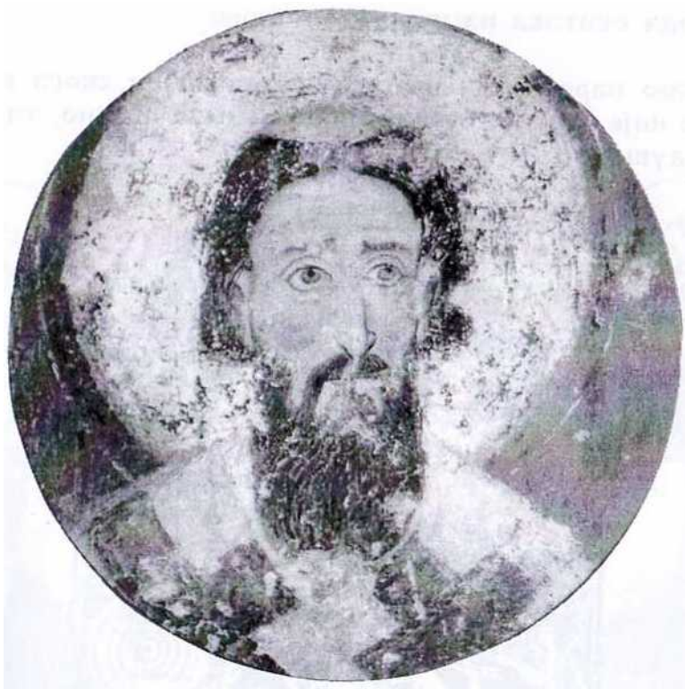
СВЕТЛА И ПРОСВЕТЉЕЊА ЗА СВЕ Свети Сава